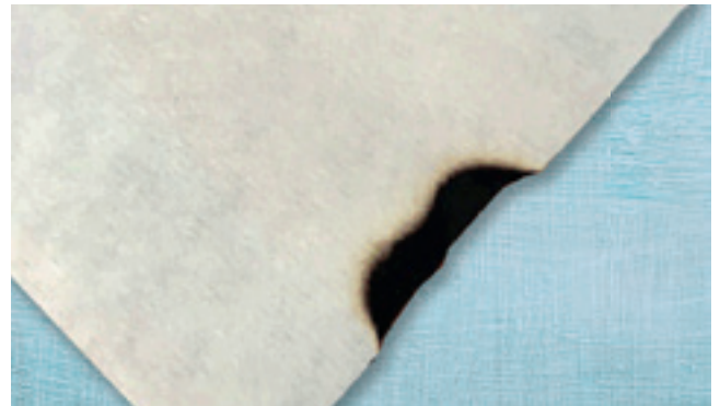
Ausgerüstet mit NONAX® FR PES