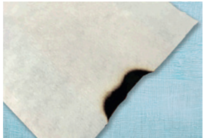
Treated by using NONAX® FR PES